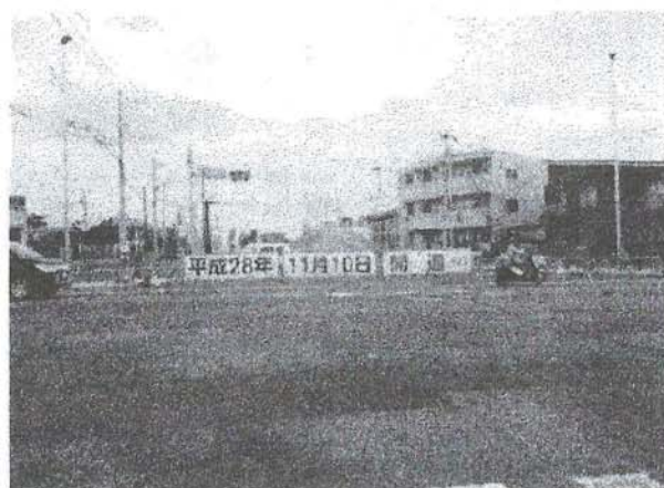
今回開通部分の3・4・18号線、国道14号線接続部分